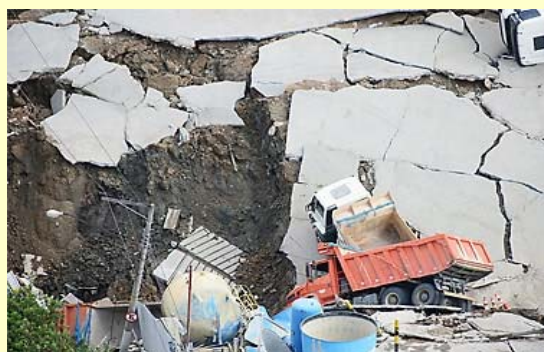
Crateras após o desabamento parcial das obras do metrô de São Paulo, Estação Pinheiros, 2007

Responsabilidade Civil tem sido um dos grandes temas na sociedade hodierna, com o avanço da tecnologia e serviços os quais podem oferecer riscos a sociedade, houve a necessidade de regulamentação do tema. Evidenciamos nos últimos anos catástrofes, como o desmoronamento do Edifício Palace II no Rio de Janeiro, e o desabamento do metrô em São Paulo, dentre outros, trazendo conseqüências sociais. Isto reforça a importância da discussão do tema e a evolução da norma jurídica visando responsabilizar pessoas e/ou entes jurídicos ao ressarcimento dos prejuízos causados pela violação de um dever jurídico tutelado. A evolução do direito veio atender uma necessidade moral, social e Jurídica garantindo a segurança de toda sociedade.